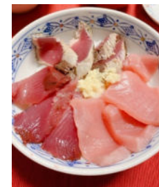
カツオの刺身・炙り・マグロ丼

8月はカツオ・マグロ解禁で相模湾は賑わいを見せますが、今年は長雨、台風も少ないので海の状態が悪く魚の活性が悪く、いい日に当たらず、同船した仲間がマグロを釣り上げたのでお裾分けを頂きました。