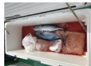
カツオのごま塩ピーマン添え