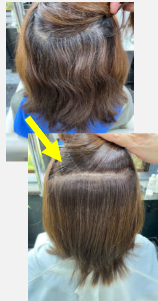
プラチナストレート¥17,600