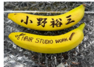
お客様から頂いた針で作った バナナアート