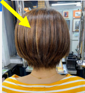
プラチナストレート¥16,500