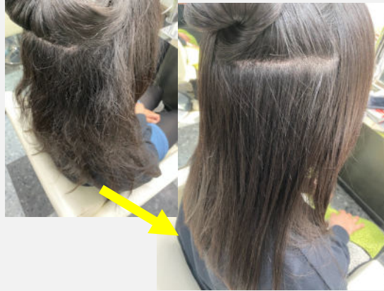
縮毛矯正 ¥22000 - 学割¥3000 = ¥19,000