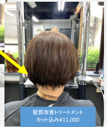
髪質改善トリートメント カット込み¥11,000