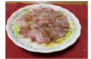
釣り友が釣ったイシナギ16 キ 。刺身・カルパッチョ