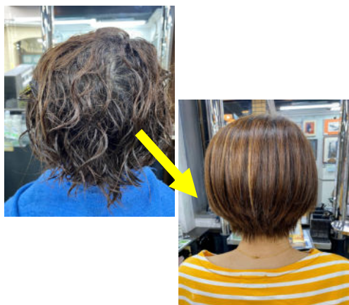
前回8ヶ月前に施術の方 プラチナストレート¥17,600