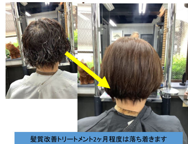
髪質改善トリートメント2ヶ月程度は落ち着きます カット込み¥11,000~12,000前後