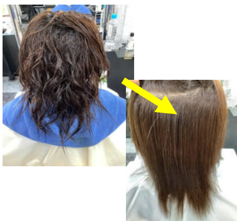
前回11ヶ月前に施術の方 プラチナストレート¥18,700