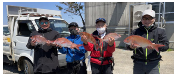
お客さまと真鯛釣り 東京湾沖