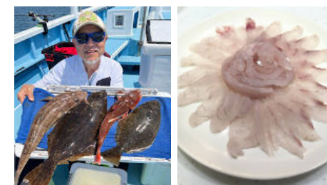
葉山沖のヒラメ・ホウボウ・イネゴチの刺身