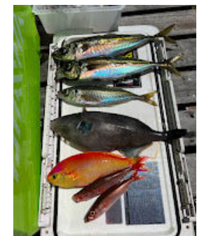
城ヶ島沖の魚↓マルイカ