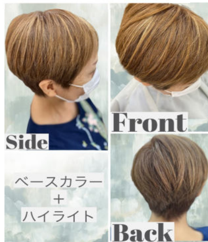
Side Front Back ベースカラー+ハイライト ¥6,600+¥1,650=¥8,250