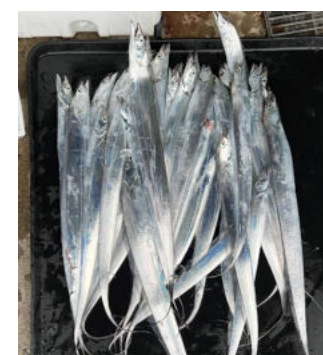
東京湾タチウオ36本