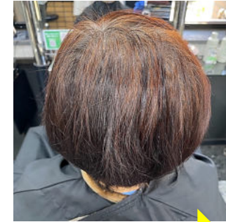
カラー前の自然ドライ