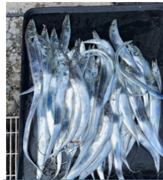
東京湾タチウオ46本