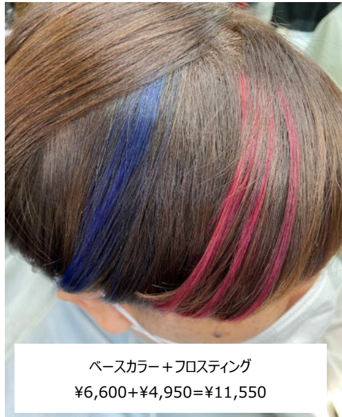
ベースカラー+フロスティング ¥6,600+¥4,950=¥11,550