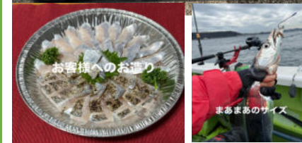
お客様へのお運び