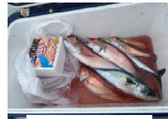
旬な甘鯛釣り 激渋でした。