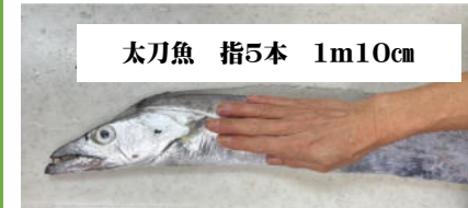
太刀魚 指5本 1m10cm