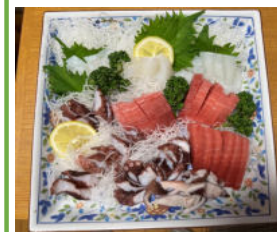
頂いたコウイカと 釣った鯛の刺身