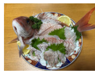
真鯛の姿造り うまかった!