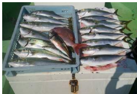
相模湾/佐島沖 真鯛1枚・イナダ14本・アジ3本