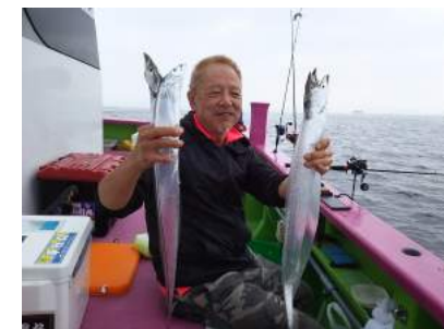
東京港/観音崎沖 タチウオ