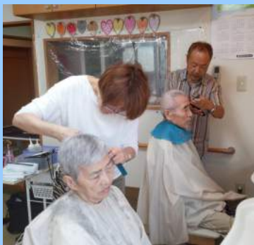
三ツ沢グループホームにて

☑表面がなめらか ☑全体を清潔に保ちます ☑マニキュアを塗ったようなツヤと輝きを出します ☑型を整えます ☑誰でも使用可能です