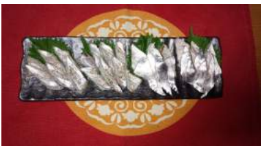
東京港/観音崎沖 タチウオ105g