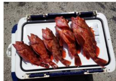
葉山沖 20~30センチのカサゴ5匹 刺身・煮物・塩焼き