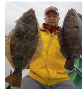
三浦沖 ヒラメ・ハタ 刺身にしました。